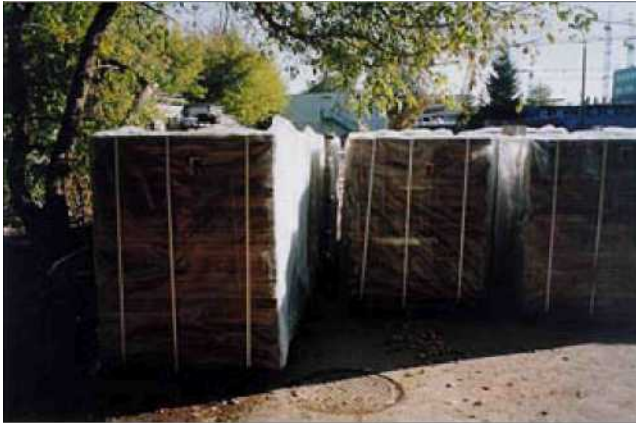
Zhermetyzowane płyty PW3/A na paletach przed transportem na składowisko